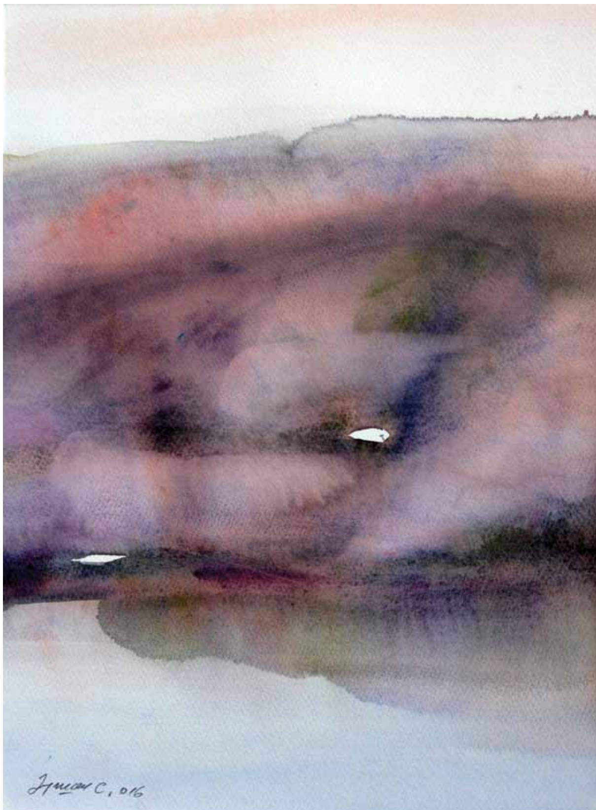
ВОДЕНА СВЕТЛОСТ 100. акварел, 35x29cm 2016.