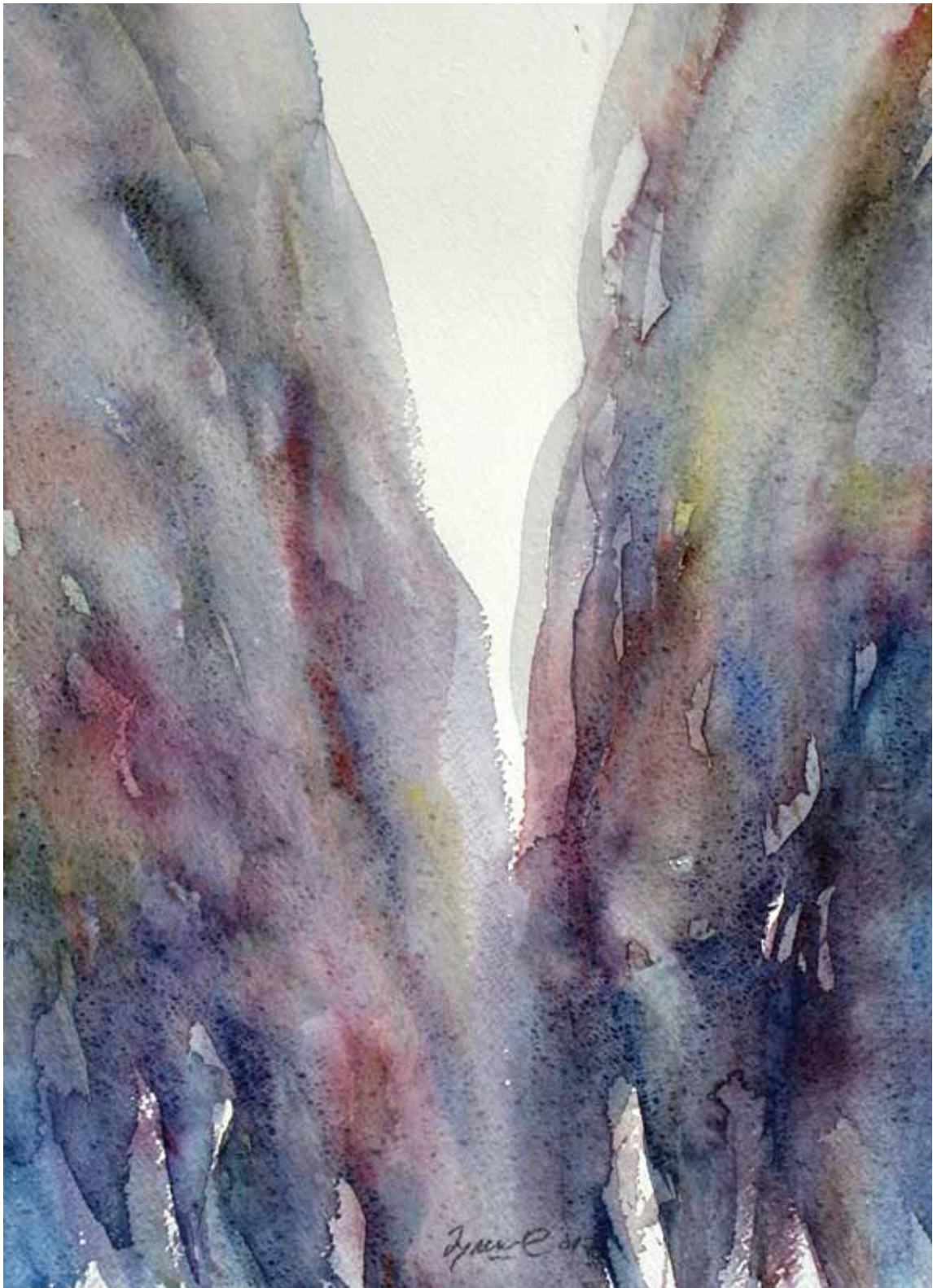
ВОДЕНА СВЕТЛОСТ 205, акварел, 52x38cm 2017.