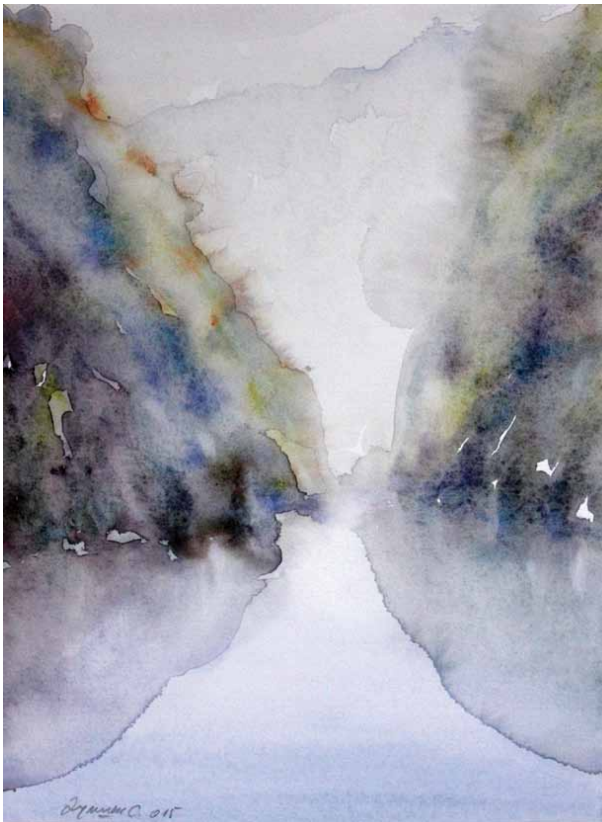
ВОДЕНА СВЕТЛОСТ 001, акварел, 35x29cm 2015.