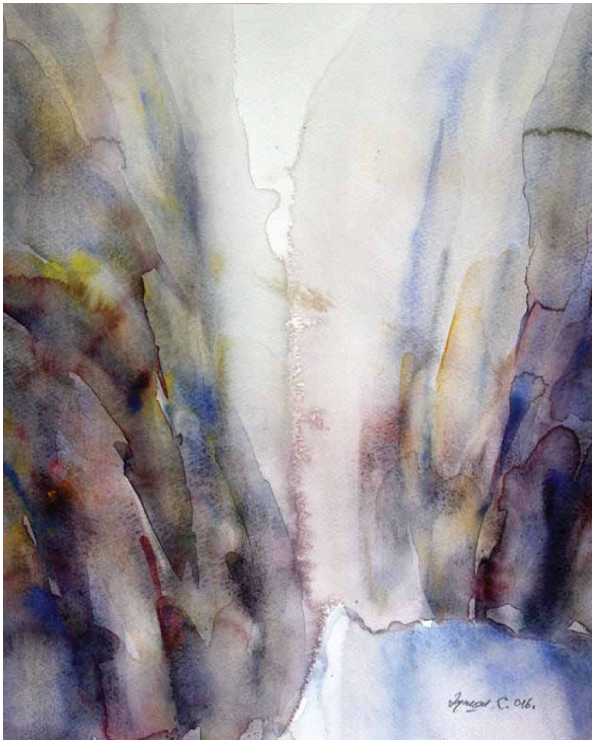
ВОДЕНА СВЕТЛОСТ 111, акварел, 35x29cm 2016.