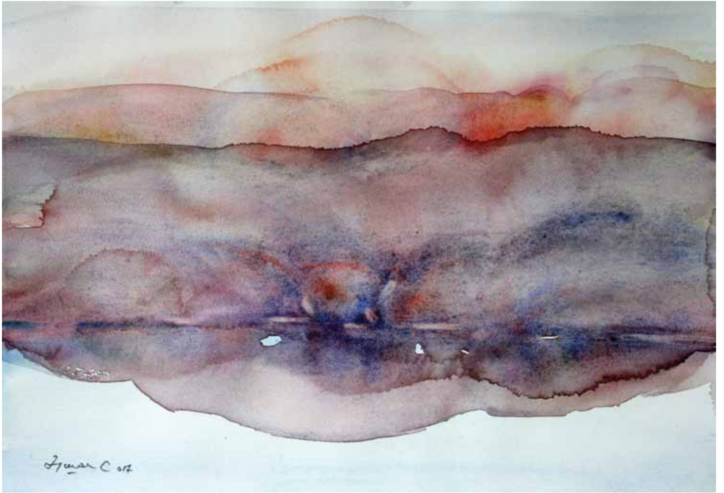
ВОДЕНА СВЕТЛОСТ 099, акварел, 58x38cm 2017.