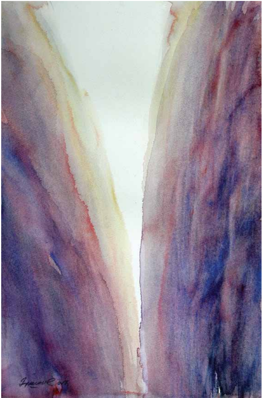
ВОДЕНА СВЕТЛОСТ 365, акварел, 58x38cm 2017.