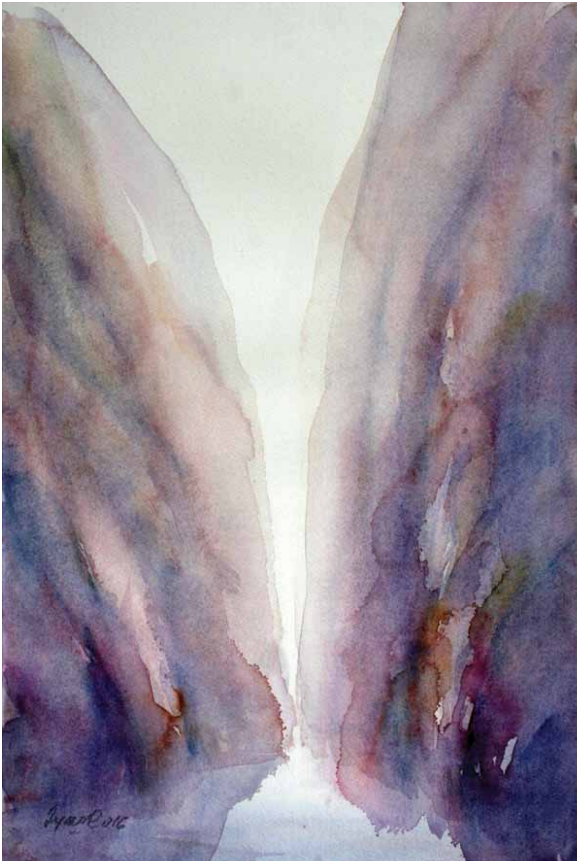
ВОДЕНА СВЕТЛОСТ 009, акварел, 58x38cm 2016.