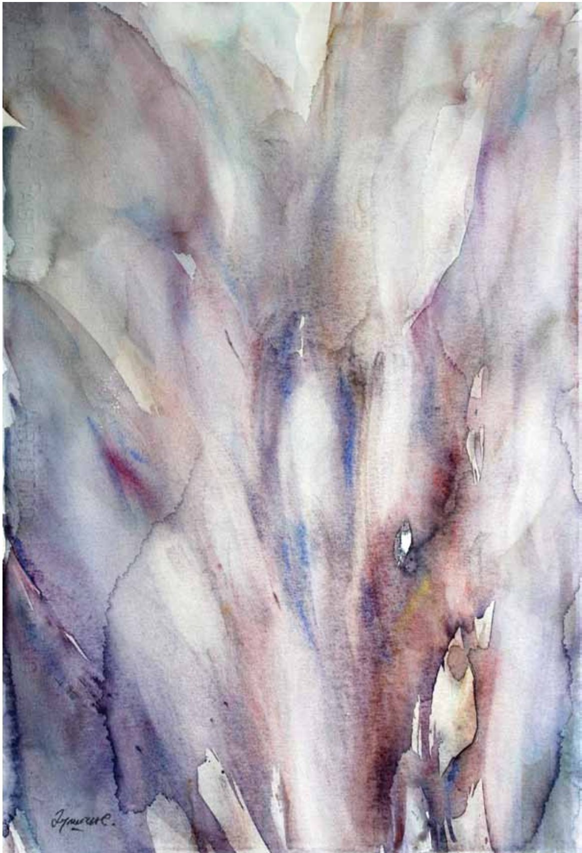
ВОДЕНА СВЕТЛОСТ 069, акварел, 58x38cm 2016.