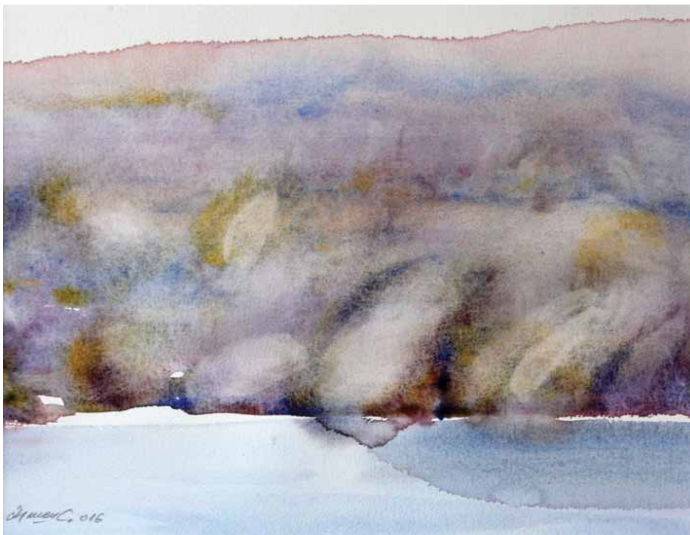
ВОДЕНА СВЕТЛОСТ 261 акварел, 29x35cm 2016.